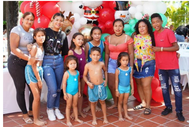
Regala una sonrisa